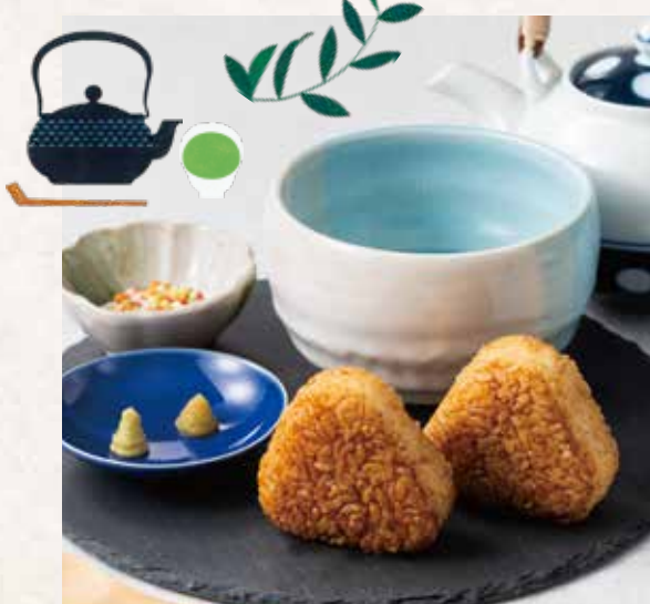
出汁かけ焼きおにぎり ¥1,100