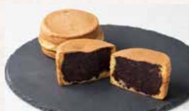
今川焼(あんこ・カスタード) 各¥500