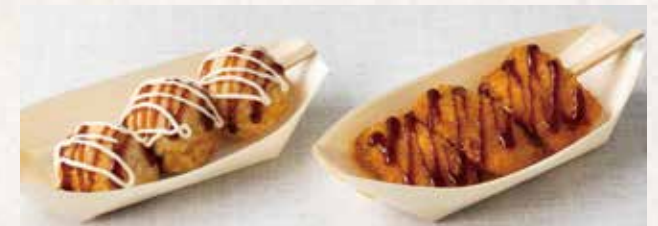
たこ焼き串 ¥450 とんかつ串 ¥650