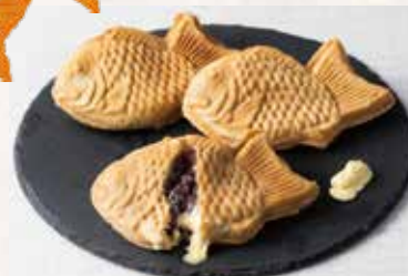
あんバターたい焼き(1匹) ¥500 ※バターは別添えになります。