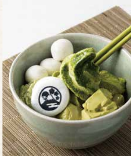
七福究極抹茶パフェ ¥1,700