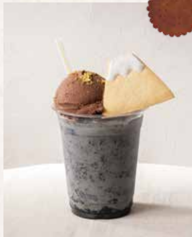
ミッドナイトブラックラテ ¥950