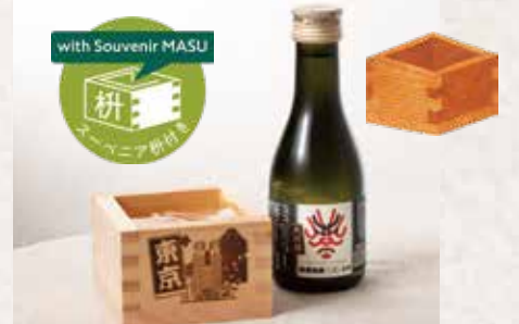
日本酒浮世絵ラベル(枀付き) ¥1,200