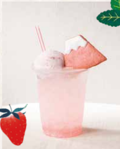
サクラストロベリーソーダ ¥950