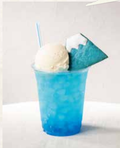
東京スカイブルーソーダ ¥950